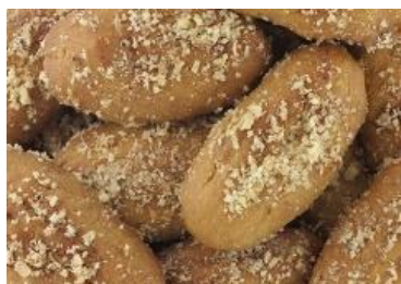
(Melomakarona aus Griechenland)

Was meinst Du: Sollten die Bräuche der Feste für ganz Europa vereinheitlicht werden oder nicht? Begründe Deine Meinung.