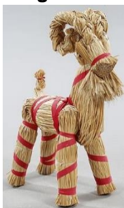
(Julbock aus Schweden)