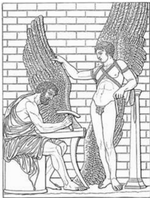
Δαίδαλος και Ίκαρος. Ρελιέφ στην Villa Albani στη Ρώμη

Άλκη Ζέη, Απόσπασμα από το μυθιστόρημα, Το καπλάνι της βιτρίνας , Μεταίχμιο, Αθήνα, 2011