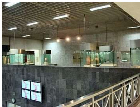
Πλατεία Συντάγματος, Αθήνα