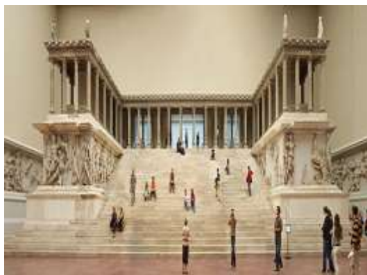
Ο Βωμός της Μιλήτου Μουσείο της Περγάμου, Βερολίνο www.portrait.gov.au

odysseus.culture.gr/h/3/gh351.jsp?obj_id=2485