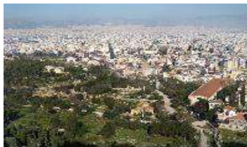
Αρχαία Αγορά, Αθήνα

odysseus.culture.gr/h/3/gh351.jsp?obj_id=2392