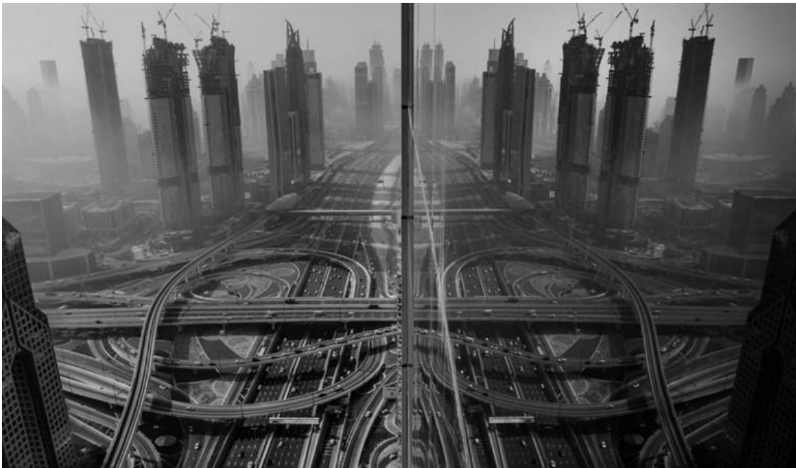
Reflejos en Dubai.

Escriba las respuestas en las hojas que se le proporcionarán.