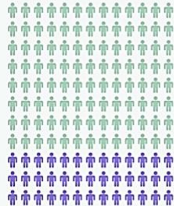
Estimación del número de hispanohablantes en 2050 y 2100 (en todo el mundo, en millones)

18% de la población estadounidense habla algún porcentaje de español.